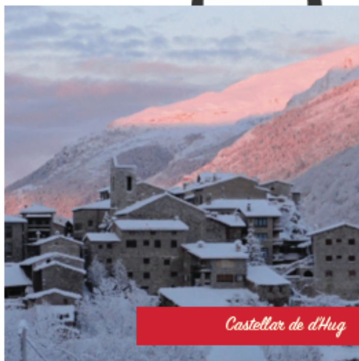
Castellar de d'Hug