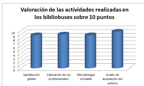
Gráfico 2: Valoración de las actividades Bibliolab en bibliobuses

Estas actividades han gozado de una muy buena acogida entre los ciudadanos, que las han puntuado con una media de 9,3 sobre 10, y destacamos como muy importante, que el 82% del personal de las bibliotecas donde se han desarrollado considera que estas actividades han conseguido atraer nuevos tipos de público a sus bibliotecas.