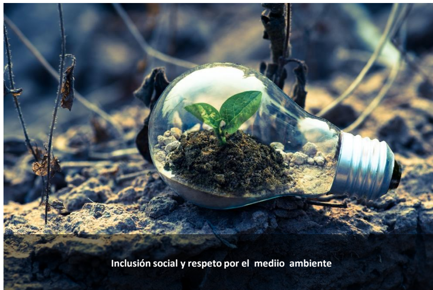
Inclusión social y respeto por el medio ambiente