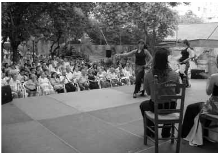
Estiu al carrer. Festival Peña Flamenca La Macarena.

A més, l'espai públic és el gran cohesionador els caps de setmana i festius de la població nouvinguda i reflecteix la diversitat de la població de Ripollet que de dilluns a divendres viu la diàspora del treball i l'escola fora del municipi.