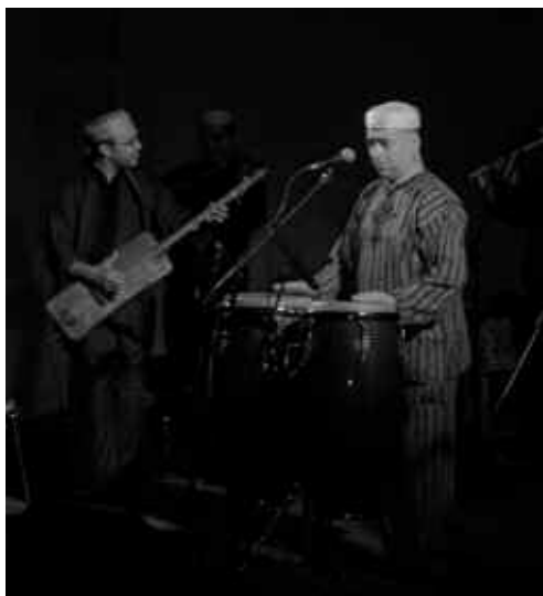
Concert Músiques del Món.

El col·lectiu Ripollet Rock organitza el cicle Rock'n'video, que té lloc al Casal de Joves, i el Festival Ripollet Rock, que contribueix a la difusió de les bandes locals adreçades a un