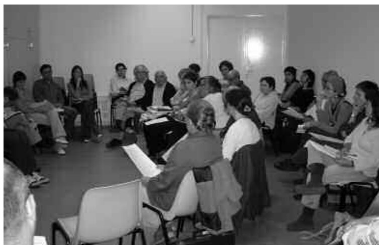
Reunió d'una taula de treball.

El conjunt del Pla d'acció cultural s'ha desenvolupat d'abril del 2005 a l'octubre del 2006.