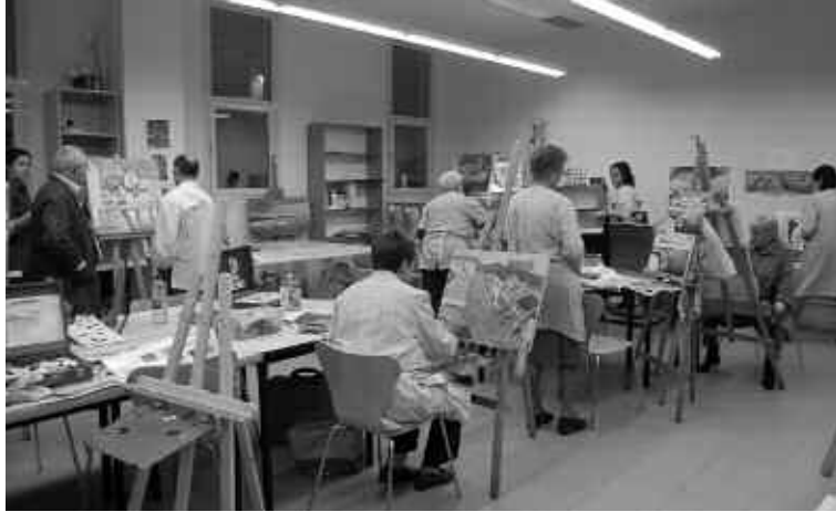
Taller de pintura al Centre Cultural.

peració amb el teixit associatiu. Però, de vegades, aquestes opinions poden fonamentar-se més en valoracions que poden tenir un rerefons polític, ateses les complexes relacions establertes entre l'Ajuntament i algunes entitats, que no pas en valoracions basades en arguments exclusivament tècnics i objectius. No obstant això, es podria plantejar, com a proposta i en virtut de la transparència, que per aplicar criteris objectius i tècnics clars caldria perfilar d'alguna manera aquelles funcions de dinamització i suport cap al teixit associatiu desenvolupades pels mateixos tècnics.