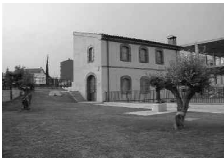
Exterior del Molí d'en Rata.

Per tant, la creació d'aquest nou equipament patrimonial pot significar la presència d'un element potent de cohesió amb vista a prestar uns serveis normalitzats en aquest camp de la cultura.