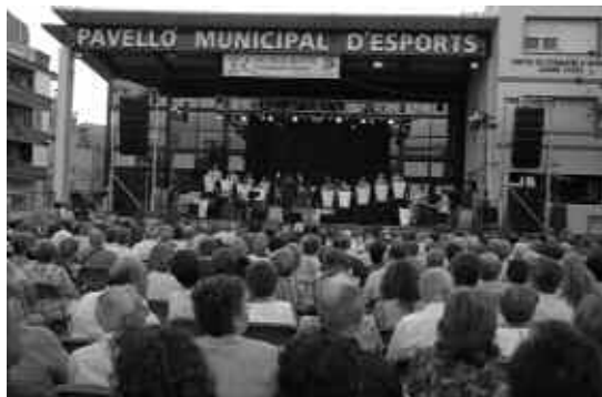
Diferents activitats de la Festa Major del 2006.

També cal tenir en compte les fires que es desenvolupen a Ripollet i que són impulsades des de les entitats. S'haurien d'enumerar, en aquest cas, la Fira dels Horts, que està relacionada amb l'ús de la llera del riu Ripoll com a espai hortícola, També el Firastock, que serveix per promoure el petit i mitjà comerç local i, finalment, la Fira de Sant Jordi a la Rambla.