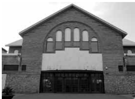
Façana del Teatre Auditori.

Si bé aquests paràmetres no poden ser presos al peu de la lletra, atès que són uns estàndards de referència que caldria, a més, que s'adaptessin a la realitat cultural de cada municipi, sí que poden ser un bon punt de partida per contrastar la situació dels equipaments culturals de Ripollet.