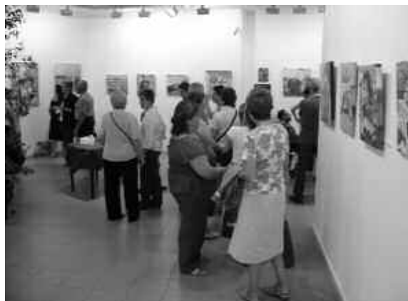
Inauguració d'una exposició al Centre Cultural.