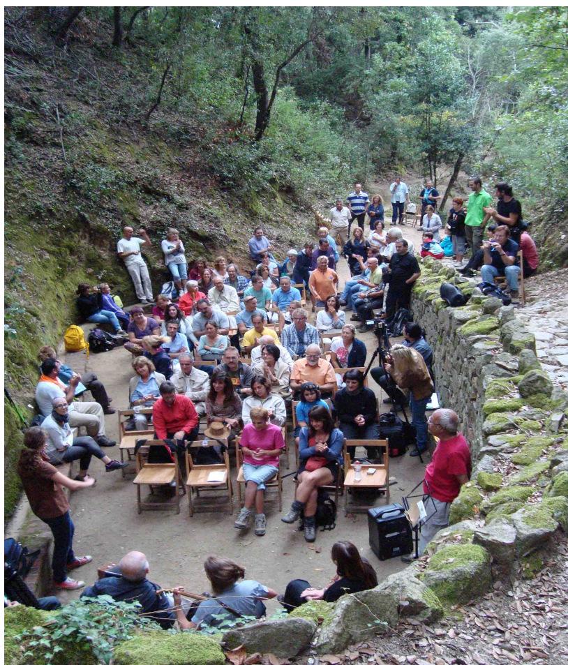
Olzinelles 2011.

http://www.youtube.com/user/poesiaalsparcs/videos?view=pl