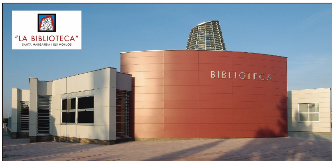
Figura 1. Vista exterior de la Biblioteca de Santa Margarida i els Monjos, seu del Centre de Documentació del Parc del Foix

A nivell de contextualització cronològica, esmentar que el Centre de Documentació del Parc del Foix neix prop de 14 anys després de l'aprovació del Pla d'Espais d'Interès Natural de Catalunya (PEIN) l'any 1992, en el qual s'inclouïa l'Espai protegit de l'embassament del Foix, així com nou anys després de la creació del Consorci del Parc del Foix l'any 1997, format inicialment per la Diputació de Barcelona i l'Ajuntament de Castellet i la Gornal i ampliat l'any 2001 amb la incorporació de l'Ajuntament de Santa Margarida i els Monjos. L'any 2012, sis anys després de la posada en funcionament del Centre, s'aprova definitivament el nou Pla Especial del Parc del Foix, avui vigent, el qual incorpora també una part del terme municipal d'Olèrdola.