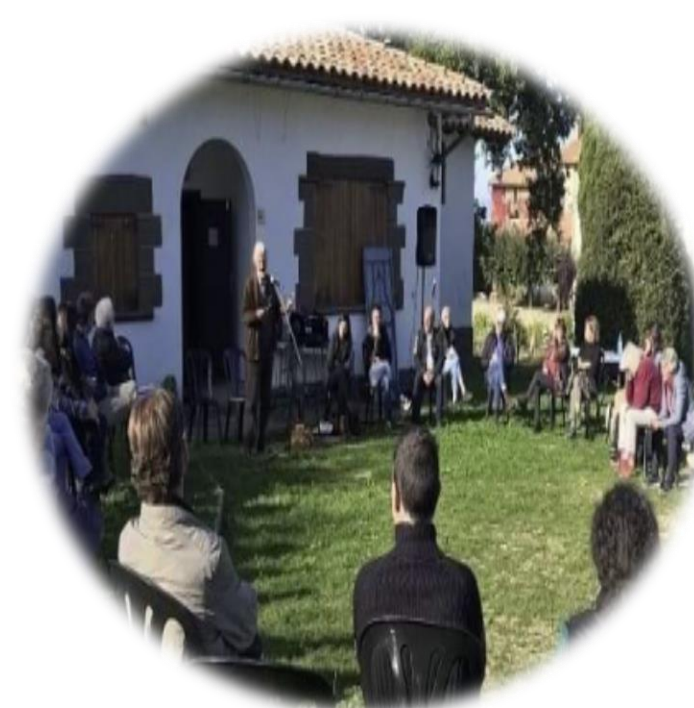
Gestión de flujos de visitantes en zonas rurales (prueba piloto en Rupit y Pruit)