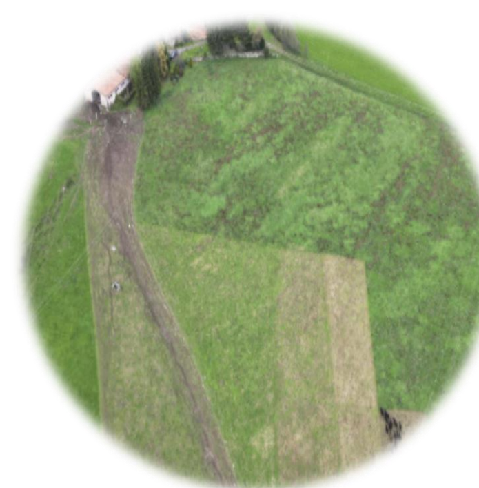
Ganadería regenerativa en el Ripollès

El proyecto está liderado por la Diputación de Barcelona (DIBA) y está implementado en 19 territorios de Cataluña . Se incluyen zonas asociadas a 7 Grupos de Acción Local (GAL) , la comarca del Alt Penedès, la región de Terres de l'Ebre y 10 parques naturales de la Diputación de Barcelona .