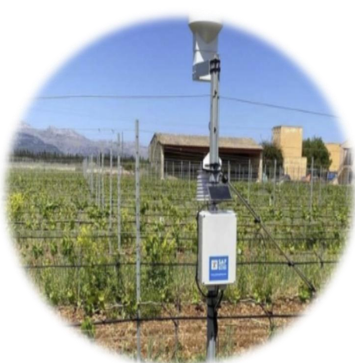
Proyecto Red BioSensores en la zona de Ponent