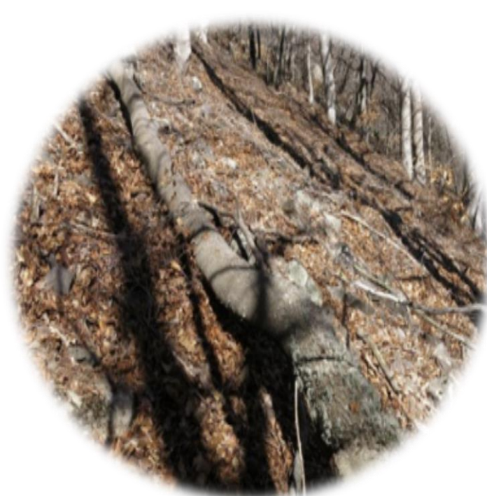
Trabajos forestales para mejorar la biodiversidad y adaptarse al cambio climático en los hayedos (montaña de Matagalls)