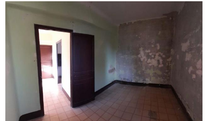
Façana de l'edifici de les antigues Escoles de Saldes i estat anterior a la intervenció de rehabilitació d'un dels habitatges de la planta superior