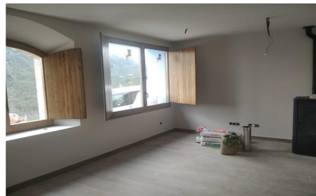
Imatges anterior i posterior a la intervenció Escola de l'Espà. Fase II. Adequació de la planta baixa i canvi a ús d'habitatge