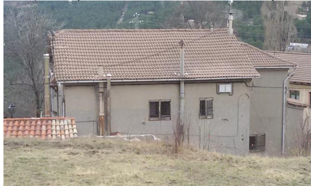
Imatges anterior i posterior a la intervenció sobre la façana. Cal Metge

Cal Metge és una edificació de titularitat municipal situada al nucli urbà de Saldes que havia estat destinada a ús de dispensari mèdic i a residència del metge i del practicant però en desús des de fa molts anys. Després de la reforma i condicionament de l'antiga residència del practicant, ubicada a la planta superior de l'immoble, ha resultat un habitatge de 67 metres quadrats amb la qualificació jurídica patrimonial d'HPO que ja ha estat adjudicat i ocupat. L'antic dispensari, ubicat a la planta baixa, resta pendent de rehabilitació i adequació de l'espai per a ús residencial.