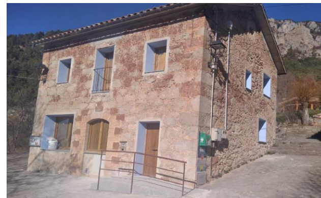
Imatges anterior i posterior a la intervenció sobre la façana de l'Escola de l'Espà. Modificació tancaments, substitució fusteries, millores d'accessibilitat