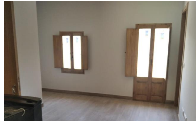
Imatges anterior i posterior a la intervenció Escola de l'Espà. Fase I. Condicionament habitatge planta superior