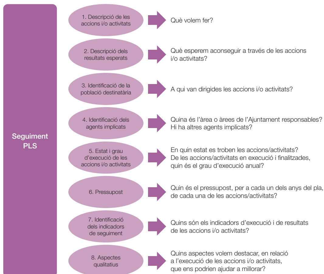
Gràfic 5. Dimensions del seguiment del PLS

A partir d'aquí, la proposta de seguiment dels PLS que es fa en aquesta Guia se centra en vuit dimensions que s'aniran treballant segons l'exemple del programa de promoció de l'exercici físic en l'adolescència.