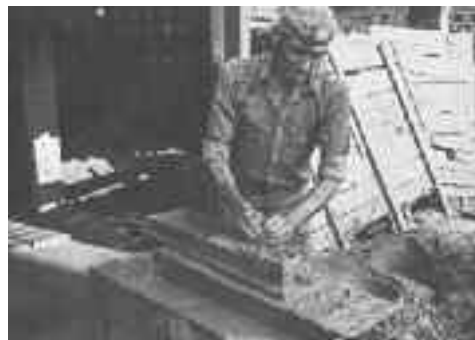
Treballadors de la Bòbila Padró Autor desconegut. Fotografies cedides per Pere Padró i Baqués CIP Molí d'en Rata