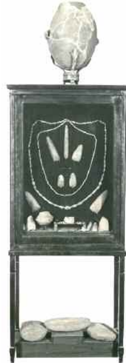
Exposició de l'aixovar al local de la Lliga Regionalista de Sabadell ca. 1930

Instituto Geográfico y Estadístico Còpia feta pel Servei Geogràfic de la Mancomunitat de Catalunya