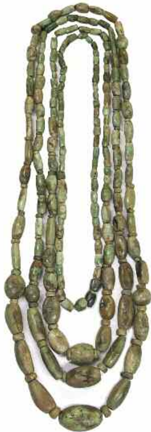
Collaret de variscita Bòbila Padró Neolític mitjà Museu d'Història de Sabadell

Aquesta petita mostra recull el viatge d'aquest collaret, des de la seva producció a les mines prehistòriques de Gavà, la seva troballa a la Bòbila Padró, entre els termes municipals de Ripollet i Cerdanyola del Vallès, fins al seu ingrés al Museu de Sabadell, que dona l'oportunitat de difondre un llegat cultural comú.