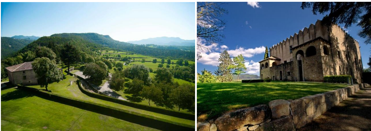
Imatges del Castell de Montesquiú. Esquerra: © Consorci Leader Ripollès, Ges, Bisaura. Dreta: Araceli Merino