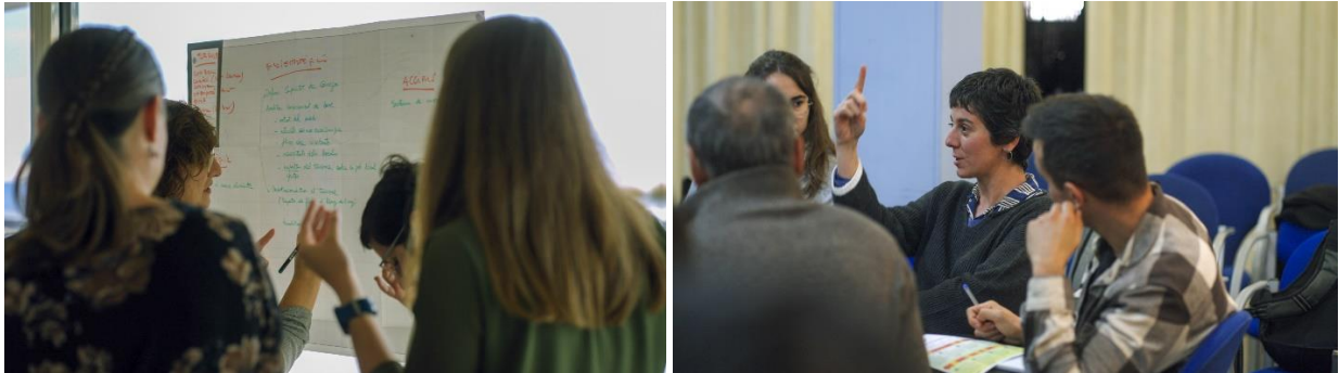
Imatges de dinàmiques participatives a la jornada de l'Estartit.

Aprendrem una metodologia de co-creació de solucions climàtiques que podrem implementar en processos participatius. L'objectiu és identificar de manera col·laborativa i inclusiva reptes i oportunitats per avançar en l'adaptació climàtica de les economies locals.