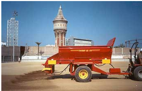
Aportació de sauló nou (cortesia de PSF)

El cost d'aquesta actuació, dependrà de les tones de sauló nou que s'aporti, podent variar de 5.000 a 7.000 euros (Iva inclòs).