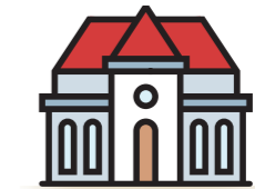
Escola Jaume Balmes