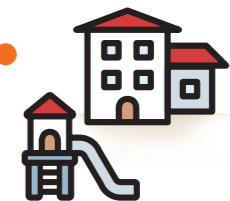
Escola bressol El Xic Martinenc